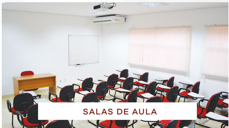
SALAS DE AULA