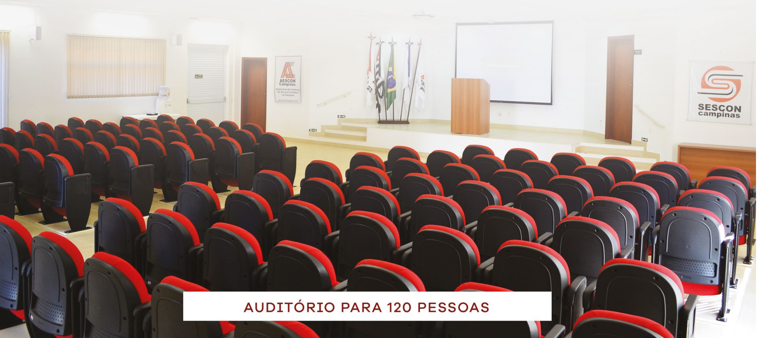
AUDITÓRIO PARA 120 PESSOAS