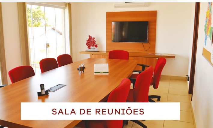
SALA DE REUNIÕES