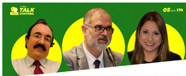
IMAGEM DO MÊS

Diferença da não cumulatividade do ICMS e PIS/COFINS e seus reflexos no creditamento